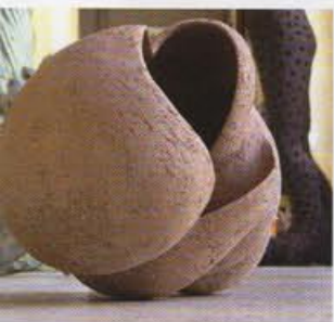
Veilleuse Grès, engobe porcelaine gravé, détail 20 cm Une conque Faïence H. 35 cm.

Vue d'atelier, 2007 Migrant 1, H. 2,27 m Narcisse et L'Hallali, H. 1,04 m Grès engobe porcelaine